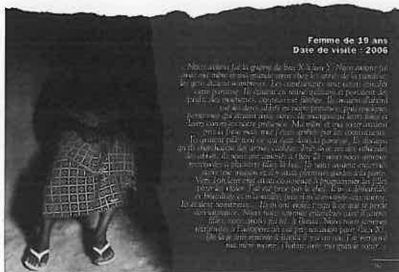
Ituri, les civils restent les premières victimes , 2007, rapport de Médecins sans Frontières.