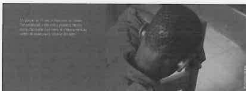
Légende : Rapport Vies Brisées , MSF, mars 2009, p. 11.

« Mais, plus profondément, c'est au nom d'un réalisme naïf que l'on peut tenir pour réaliste une représentation du réel qui doit d'apparaître comme objective non pas à sa concordance avec la réalité même des choses (puisque elle ne se livre jamais qu'à travers des formes d'appréhension socialement conditionnées) mais à la conformité des règles, qui en définissent la syntaxe dans son usage social (...) » (Bourdieu, 1965, p. 108).