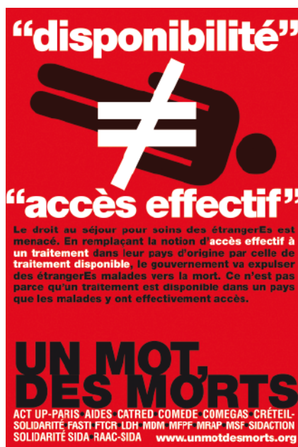
Campagne un mot, des morts, mars 2011

Président d'honneur de la Société Française de Santé Publique