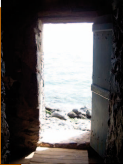
Île de Gorée, Sénégal