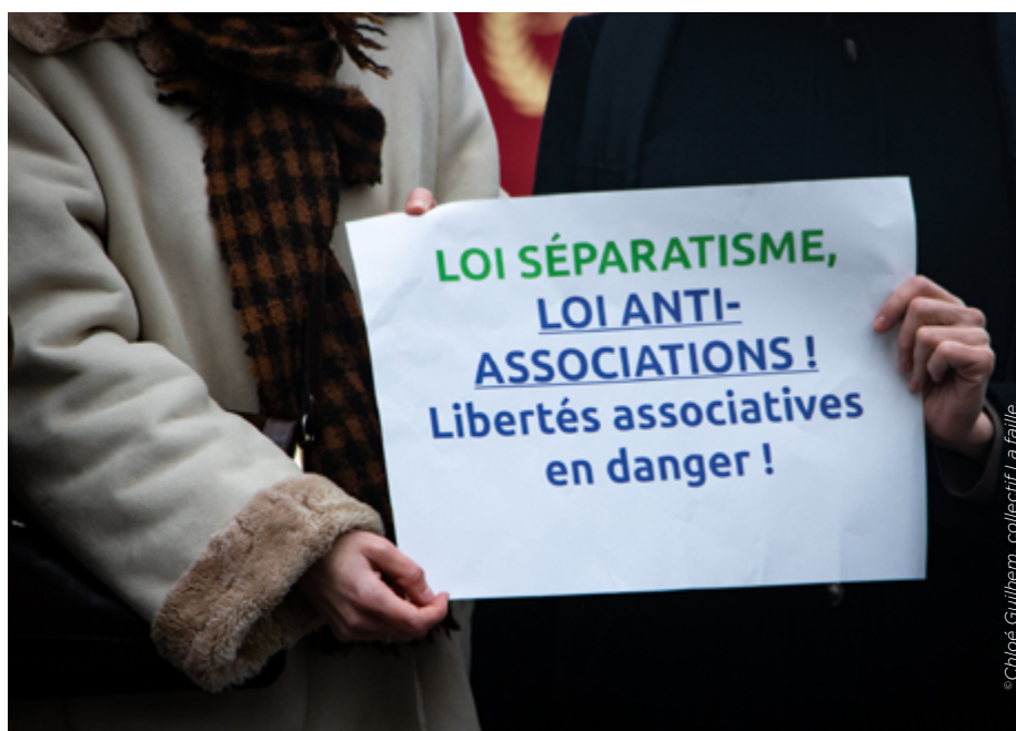
La Coalition : https://www.lacoalition.fr/

La Coalition pour les libertés associatives et son Observatoire éponyme ont vu le jour en 2019 pour dénoncer ce phénomène de restriction de l'espace démocratique et de recul des libertés. Constatant une recrudescence des entraves à leurs activités, des