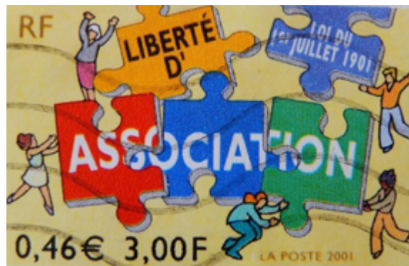
Timbre 2001, Liberté d'association. Centenaire Loi 1901.

Or, elles se trouvent aujourd'hui ébranlées par plusieurs lois, dont la loi dite sur le séparatisme et son contrat d'engagement républicain. Curieuse inversion des rôles, l'État demande aux associations de respecter des principes qu'il bafoue, en particulier vis-à-vis des étrangers, ce pour quoi il a été maintes fois condamné par les tribunaux administratifs et la Cour européenne des droits de l'homme. Il dispose désormais d'un pouvoir arbitraire de sanction des associations. Sans fondement légal, plusieurs ont récemment été dissoutes et d'autres savent leurs budgets menacés. Le risque d'une telle politique est de contraindre les associations à l'autocensure, restreignant plus encore l'espace démocratique. Le Comede ne cédera pas à ces pressions et continuera comme par le passé à accomplir ses missions dans le domaine de la santé et des droits des personnes exilées.