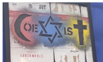
Combo-festival Colors 2022

La pratique laïque française se caractérise aussi par l'accent particulier mis sur la neutralisation religieuse des bâtiments de l'État, des collectivités territoriales et des services publics et sur le devoir de neutra-